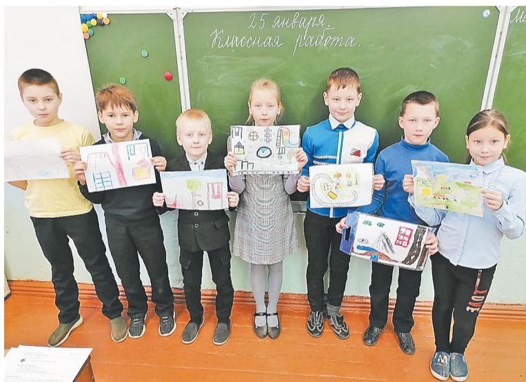
Школьники Опеченского Посада участвуют в проекте ППМИ по строительству площадки «Остров детства»

Реализуется на территории поселения и программа «Дорога к дому». Только за период прошлого года здесь потрачено на ремонт дорог более 4 млн. рублей. Большие планы будут воплощены и в этом году. Опеченский Посад богат талантливыми, активными, трудолюбивыми людьми, любящими свою малую родину. А значит – у села и его жителей есть реальные перспективы.