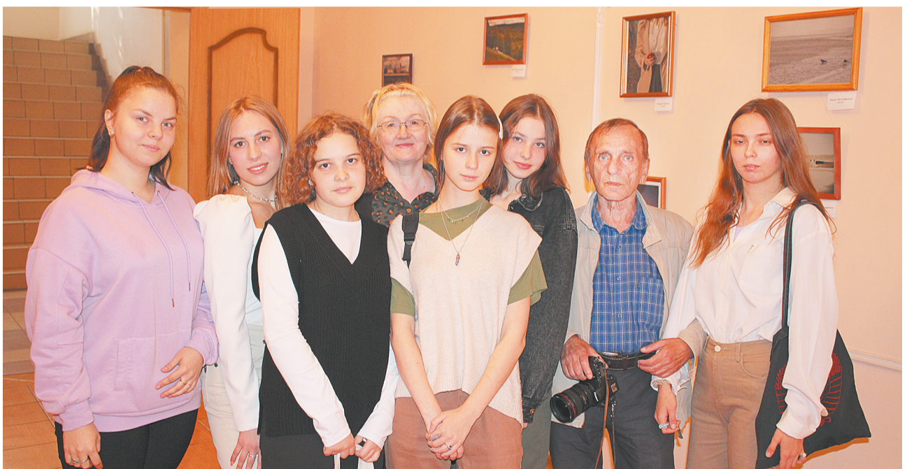
Молодые фотографы со своими педагогами

Идея собрать выставку под названием «Это лето» пришла именно к педагогам. Они объединили 12 юношей и девушек, дали задания, подсказали темы. Поэтому на выставке можно увидеть разные направления: портреты, пейзажи, натюрморты.