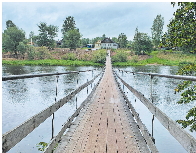
Подвесной мост – не только переправа, но и украшение села