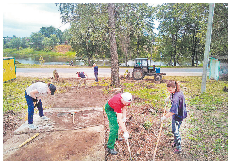
Сельские жители дружно вышли на субботник