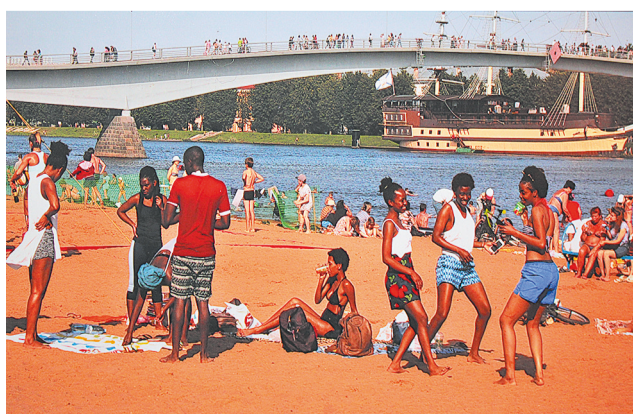
«Пляж в Великом Новгороде».

Таланты растут в нашем городе. Выставка – главное тому доказательство!