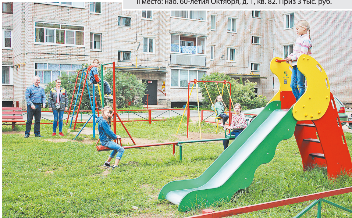
Двор на набережной 60-летия Октября, 6

I место: ул. Южная, 8, кв. 37. Приз 5 тыс. руб. II место: наб. 60-летия Октября, д. 1, кв. 82. Приз 3 тыс. руб.