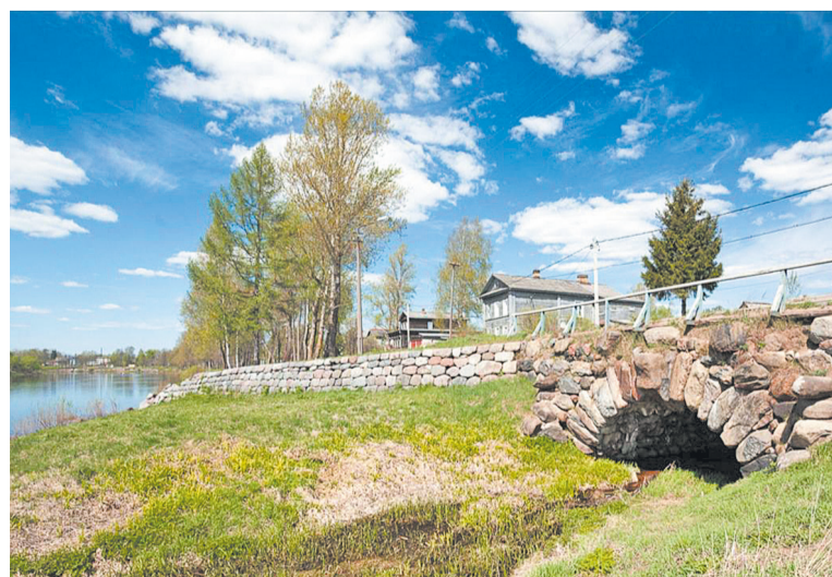
Каменный арочный мост в Опеченском Посаде – со времён судоходства