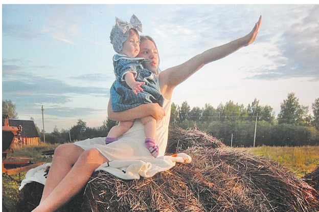
«На стоге сена». Фото Полины Владимирской